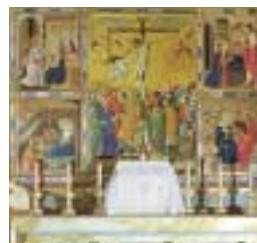
Kaplica Przenajświętszego Sakramentu.

Dnia 31 grudnia 1959 roku Święty Josemaría odprawił pierwszą Mszę Świętą w Kościele Najświętszej Maryi Panny Królowej Pokoju. Kościół ten, od chwili erekcji Opus Dei jako Prałatury Personalnej stał się Kościołem Prałackim. Nabożeństwo Św. Escrivy do Najświętszej Maryi Panny sprawiło, że kościół jest pod takim właśnie wezwaniem, a w głównym ołtarzu widnieje wizerunek Najświętszej Maryi