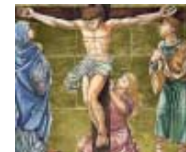
Droga Krzyżowa, stacja XII: Chrystus na Krzyżu. Ceramika.

Panny Królowej Pokoju. W krypcie kościoła znajduje się Kaplica Przenajświętszego Sakramentu oraz konfesjonały. Święty Josemaría nieustannie mówił o konieczności częstego przystępowania do Sakramentu Pokuty i Eucharystii, darów Boga dla swoich dzieci, źródła pokoju i nieprzemijającej radości.