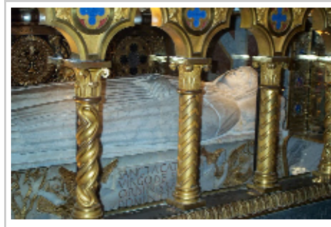
I resti mortali di Santa Caterina di Siena riposano in un sarcofago sotto l’altare maggiore della Chiesa di Santa Maria Sopra Minerva

Anni dopo, quando la Chiesa stava attraversando grandi difficoltà, San Josemaria ricorse nuovamente a Santa Caterina, poiché ella aveva difeso appassionatamente la verità in circostanze in qualche modo simili. Scrisse: “Ho alimentato il fuoco della devozione per Santa Caterina da Siena, che in me risale a molto tempo fa, perché lei sapeva come amare il Papa con amore filiale, perché sapeva come servire nel sacrificio la santa Chiesa di Dio, e come testimoniare la verità eroicamente”.